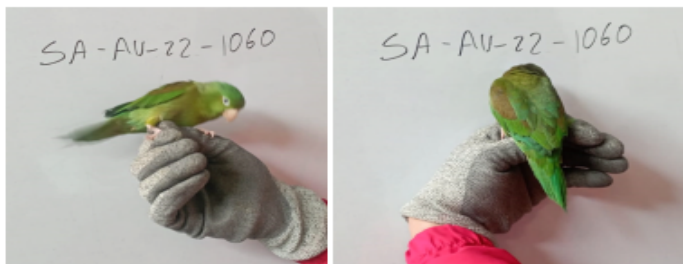
Fotografías 2 y 3. Verificación del individuo Brotogeris jugularis (Perico bronceado) incautado, rótulo SA-AV-22-1060, detalle presencia de líneas de estrés. Acta Única de Control al tráfico ilegal de flora y fauna silvestre No. 161674.